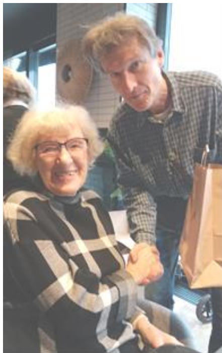
Poděkování na setkání dobrovolníků

Od 22. 12., po dopolední mši svaté, si můžete přijít do chrámu pro Betlémské světlo.